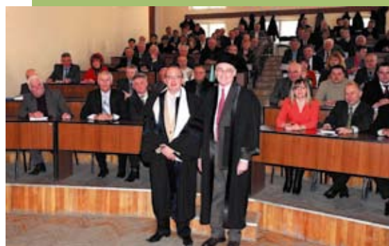
Первый в Украине учебный центр Delcam был открыт в Запорожском национальном университете

Учебный центр при Запорожском национальном университете достиг столь высоких результатов, что его позитивный опыт стал распространяться на другие университеты в восточной части Украины, где расположена большая часть промышленных предприятий. Запорожский университет согласился помочь обучать преподавателей других вузов региона и